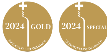
Gold awarded wine list and Ueli Prager Price

Wein offen oder Flasche Wine by the glass or bottle Vin ouvert ou en bouteille